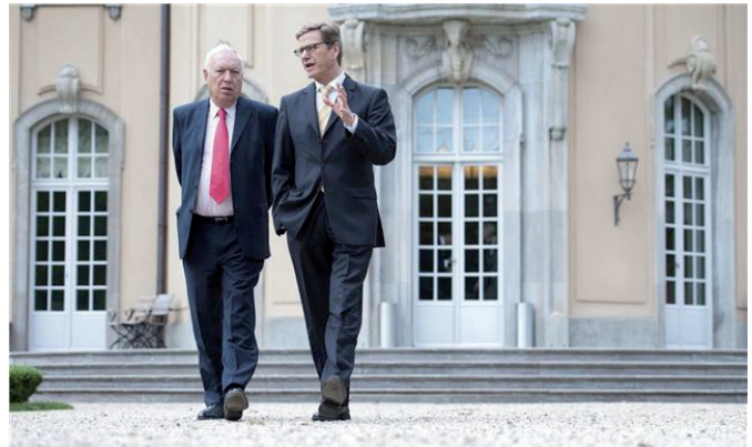
El Ministro de Asuntos Exteriores y de Cooperación, José Manuel García-Margallo, junto al Ministro de Exteriores alemán, Guido Westerwelle, en un encuentro celebrado en Berlín en junio de 2012.

En el contexto de las semanas de Alemania en España, inauguradas el 12 de abril de 2011, el Presidente de la Comisión de Asuntos Exteriores del Bundestag, Sr. Polenz, hizo una visita en Madrid.