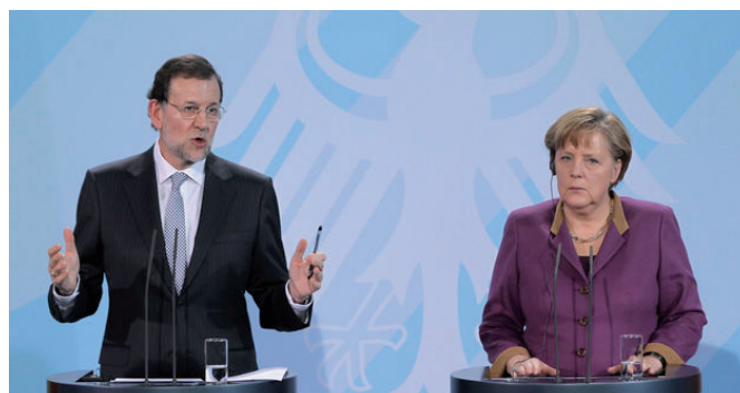
El Presidente del Gobierno, Mariano Rajoy, junto a la Canciller alemana, Ángela Merkel, durante la visita que realizó a Berlín en enero de 2012