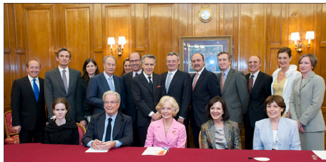
Foto de familia de la reunión de la Gobernadora General Quentin Alice Louise Bryce con el Patronato de la Fundación Consejo España-Australia, durante su visita a España en junio de 2011.

Australia es una potencia media cuyos intereses vienen definidos por la historia y la geografía. Junto a su tradicional estrecha relación con el Reino Unido y Estados Unidos, mantiene una creciente proyección en Asia (donde se encuentran sus principales socios comerciales), y es especialmente activa en el marco de la cuenca sur del Pacífico. La UE en su conjunto constituye su principal socio comercial.