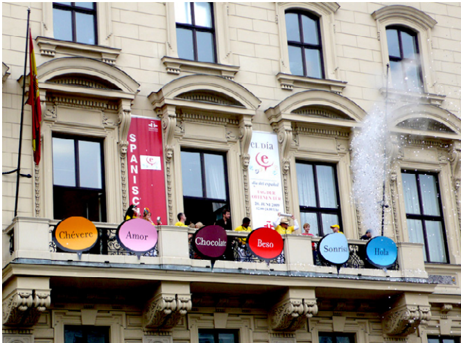
Fachada del Instituto Cervantes de Viena

Por otro lado hay que reseñar la concesión a Javier Marías en julio 2011 del Premio Nacional de Literatura Europea 2011. Se trata de un galardón que cada año concede el Ministerio de Cultura austriaco a un escritor europeo de prestigio. Al acto asistió la Ministra de Cultura, Sra. González Sinde. En ocasiones anteriores recibieron este premio, entre otros, Jorge Semprún, Claudio Magris y Umberto Eco. También es digno de mención el premio a la Creatividad y la Innovación concedido en 2011 por la Cehaus (Cámara de Comercio hispano-austriaca) a los arquitectos Moneo y Hollein.