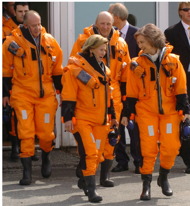
SS.MM. los Reyes de España, junto a los Reyes Harold y Sonja de Noruega, durante su visita a la plataforma petrolífera marina Troll A, cerca de la ciudad de Bergen, en su visita a Noruega realizada en junio de 2006.

Las relaciones políticas bilaterales hispano-noruegas han transcurrido tradicionalmente en un tono de amistad y cordialidad, existiendo un diálogo político continuo en temas de mutuo interés. Esta relación bilateral cuenta con unos