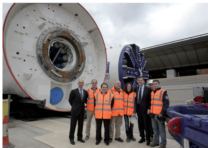
El presidente del Gobierno, Mariano Rajoy, con el presidente de Ferrovial, Rafael del Pino, durante su visita a Londres en el año 2012 a las obras que desarrolla una tuneladora española en la capital británica.

Canje de notas por el que se adopta el Convenio entre el Reino de España y el Reino Unido de Gran Bretaña e Irlanda del Norte en nombre de Anguila, relativo