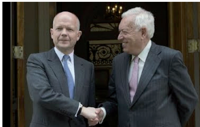
El ministro de Asuntos Exteriores y de Cooperación, José Manuel García-Margallo, saluda a su homólogo británico, William Hague, durante su visita a Londres en mayo de 2012.

David William Donald Cameron fue elegido Primer Ministro en las Elecciones Generales de mayo de 2010. Encabeza un gobierno de coalición conservador / liberal demócrata. Nació en Londres el 9 de octubre de 1966, pero creció en Berkshire. Cursó la educación secundaria en Eton College y estudios universitarios en la Universidad de Oxford, donde estudió Filosofía, Ciencias Políticas y Económicas (PPE), obteniendo los mejores resultados de su promoción. Tras licenciarse, trabajó para el Departamento de Investigación del Partido Conservador y, posteriormente, como Asesor Especial en el gobierno, primero del Ministro de Economía y, después, del Ministro del Interior.