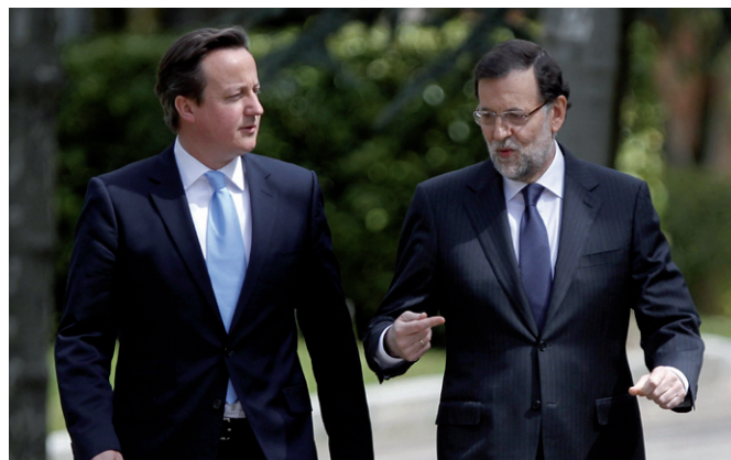
El primer ministro británico, David Cameron, conversa con el presidente del Gobierno, Mariano Rajoy, durante un paseo por los jardines del Palacio de la Moncloa, en el marco de la visita que realizó a España en abril de 2013.

Existe una presencia importante de empresas españolas en el Reino Unido (siendo Zara la empresa comercial de mayor envergadura en este país), más de 300 compañías, muy diversificada por sectores, entre los que destacan: bancos y servicios financieros; infraestructuras de transporte; energía; medioambiente y tratamiento de residuos y agua; distribución de productos de consumo (moda,