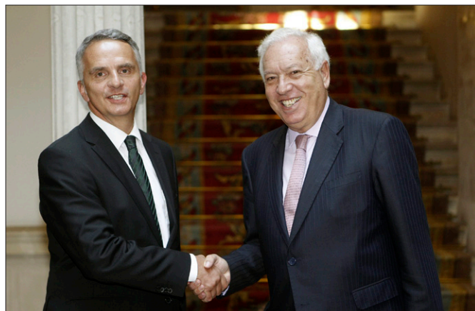
El ministro de Asuntos Exteriores y Cooperación, José Manuel García Margallo, saluda a su homólogo suizo, Didier Burkhalter, durante su visita a España en octubre de 2012.

11-10-2003 S.M. El Rey don Juan Carlos. Exposición ITV Telecom. World-2003. 18-10-2004 S.M. el Rey, acompañado de la Ministra de Educación y Ciencia. Ginebra, 50º aniversario del CERN. 7-3-2005 SSMM los Reyes, acompañados del Ministro de Asuntos Exteriores. Visita a Naciones Unidas y Organismos Internacionales. 18-11-2008 : SSMM los Reyes acompañados del Jefe del Gobierno, D. José Luis Rodríguez Zapatero, así como el Presidente de las Islas Baleares, D. Francesc Antich i Oliver. Visita a la inauguración de la obra del pintor mallorquí Miquel