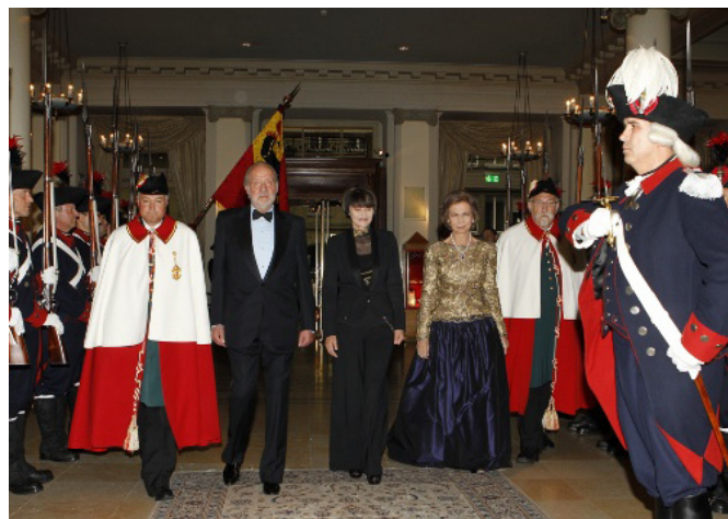
SS.MM. los Reyes, junto a la Presidenta de la Confederación Micheline Calmy-Rey durante su visita a Suiza en mayo de 2011

Nació en Neuchâtel en el cantón de Neuchâtel el 17 de abril de 1960. Es licenciado en Ciencias Económicas y Políticas. Está casado y tiene tres hijos.